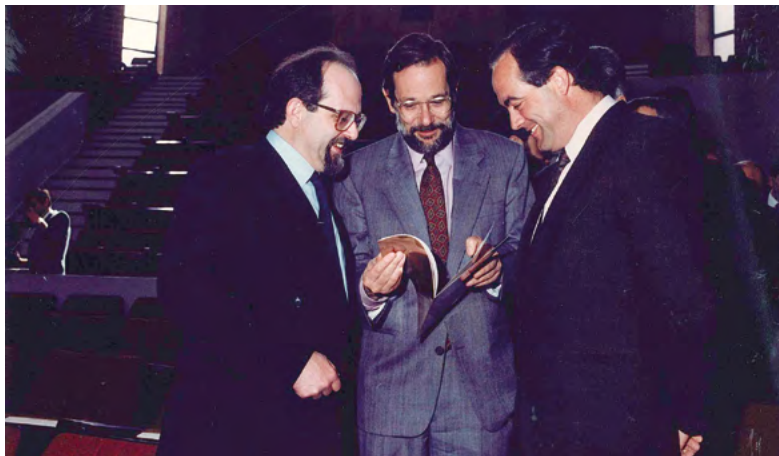
Visita de Javier Solana, ministro de Educación. Para la constitución del Consejo Social. Albacete 22 de abril de 1991