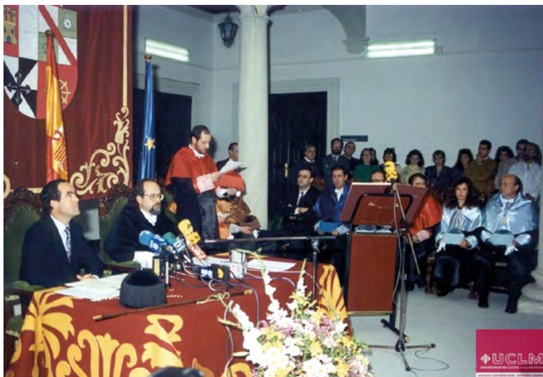
Toma de posesión en el claustro de la calle Paloma, Ciudad Real 22 de enero de 1991