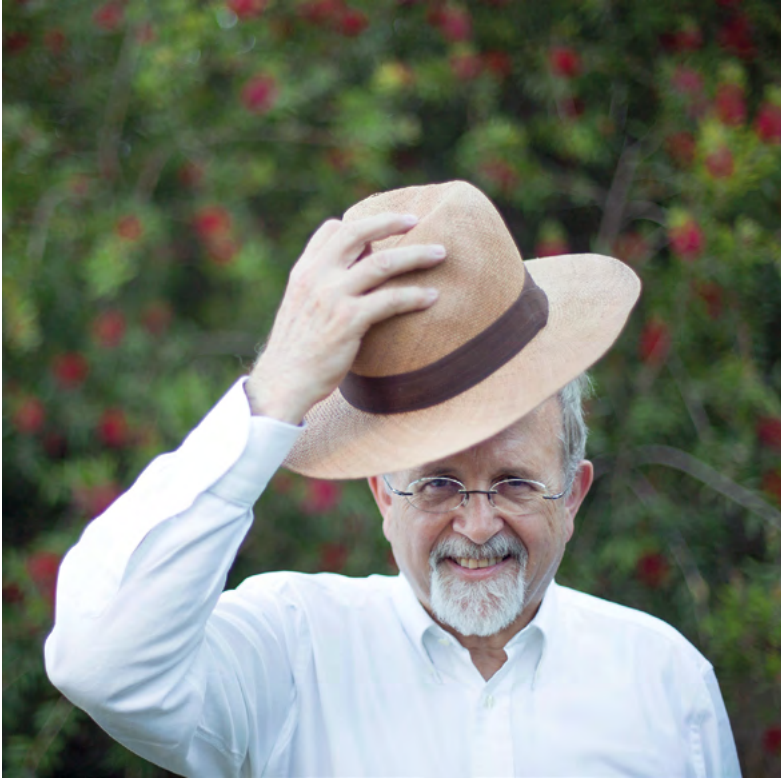
... y despedida.