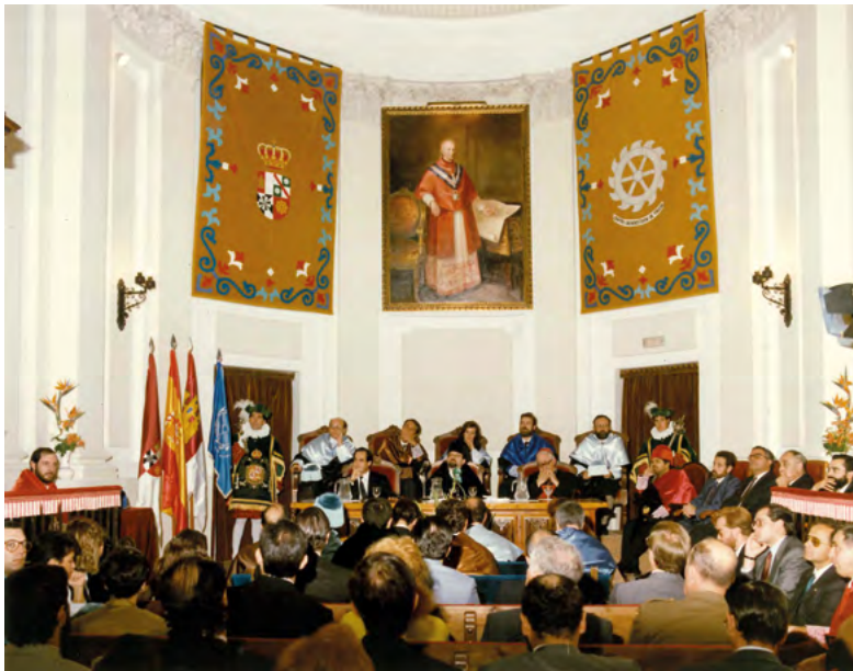
Inauguración de curso octubre 1989. Toledo