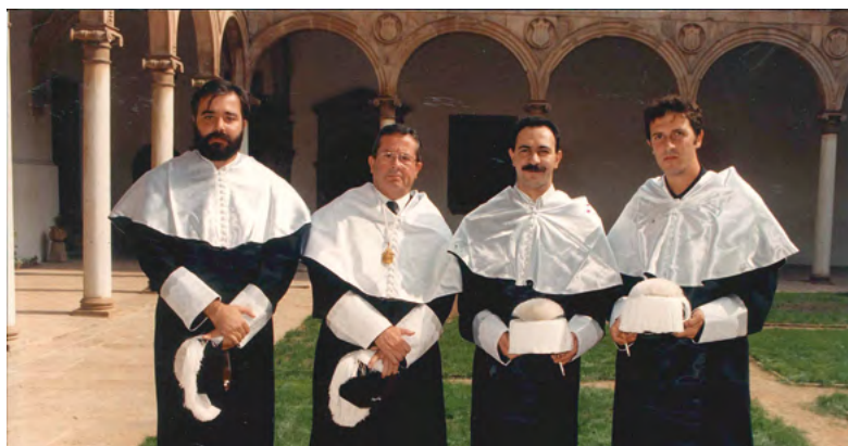
Los profesores de Derecho, de Bellas Artes y de Económicas. Almagro, octubre de 1990