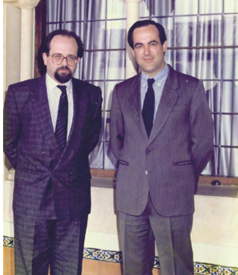
Presentación al presidente José Bono tras la primera elección por el claustro, 18 de marzo de 1988