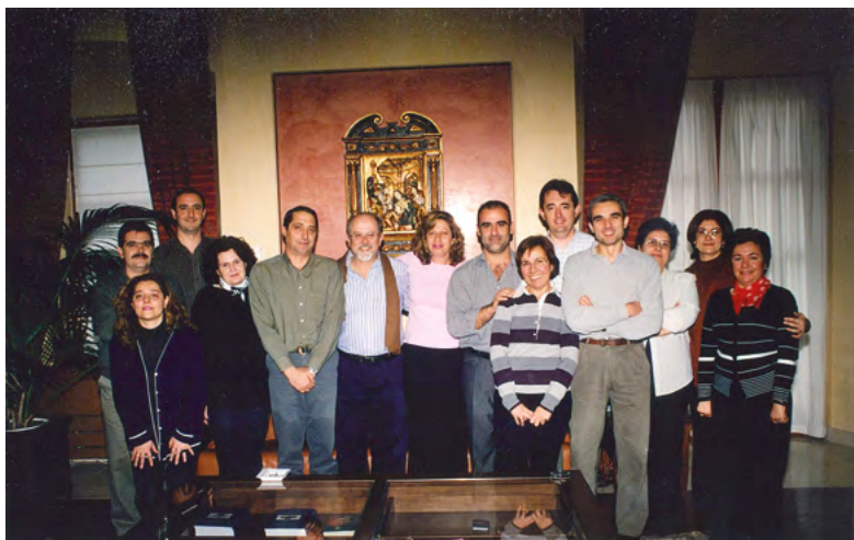
Despedida de los colaboradores de Administración y Servicios del Rectorado. Diciembre de 2003