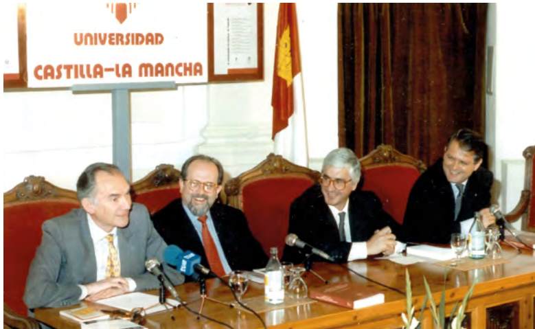
Conferencia de Francisco Tomás y Valiente en el Palacio de Lorenzana en Toledo, con José María Barreda y Luis Ortega, mayo de 1993.