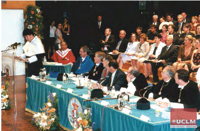
Doctorado de Pedro Almodóvar. Cuenca, 29 de junio de 2000