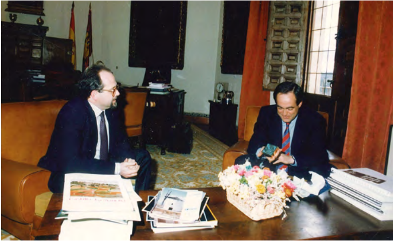
Presentación al presidente José Bono tras la segunda elección por el claustro. 18 de diciembre de 1991.