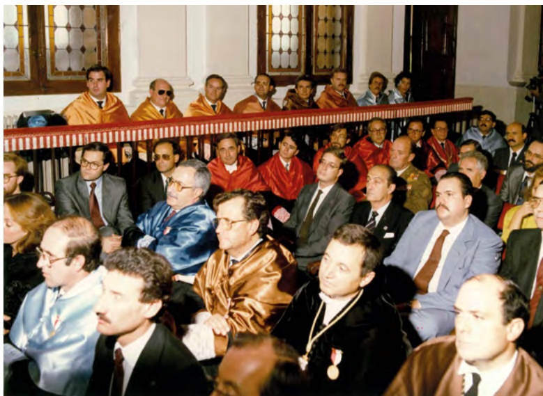
Inauguración de curso octubre 1989, Paraninfo de Lorenzana