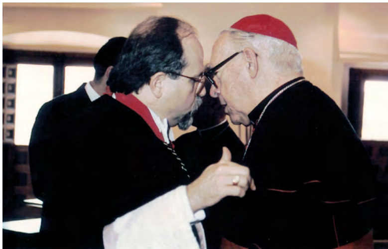
Confidencias con el cardenal don Marcelo González Martín en la inauguración del Rectorado, 26 de junio de 1998.